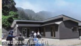
災害公営住宅（田野畑村）