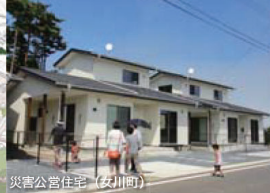
災害公営住宅（安川町）