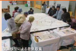
復興模型による意見収集