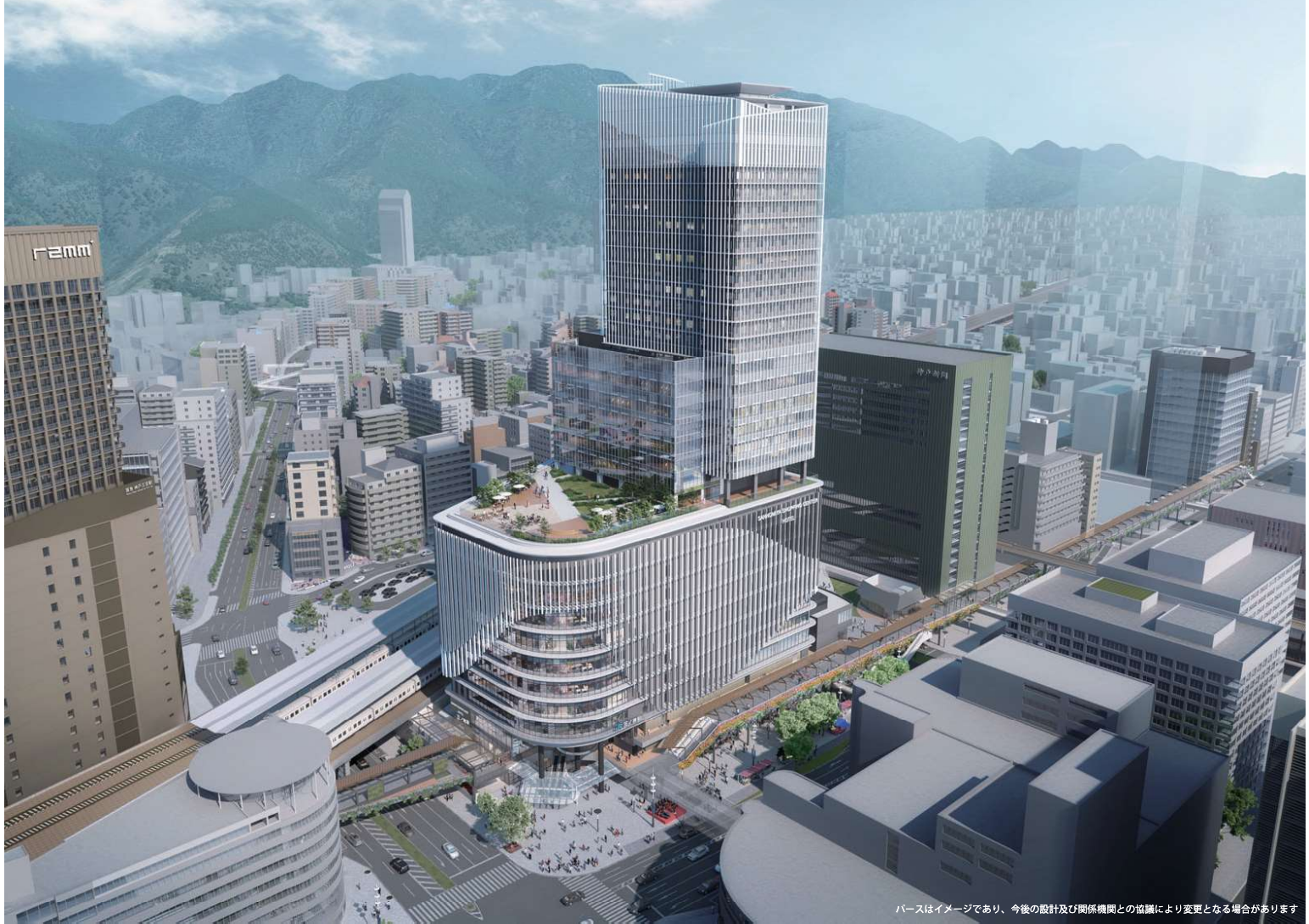
パースはイメージであり、今後の設計及び関係機関との協議により変更となる場合があります