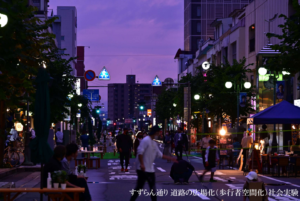
すずらん通り 道路の広場化(歩行者空間化)社会実験