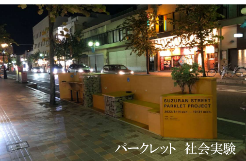
パークレット 社会実験