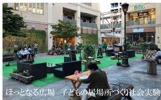
ほっとなる広場 子どもの居場所づくり社会実験

今、中心市街地における新たなまちづくりとして注目されている居心地が良く歩きたくなるまちなかづくり(まちなかウォーカブル)。全国で人中心の街路づくりや、そのための社会実験が実施されています。