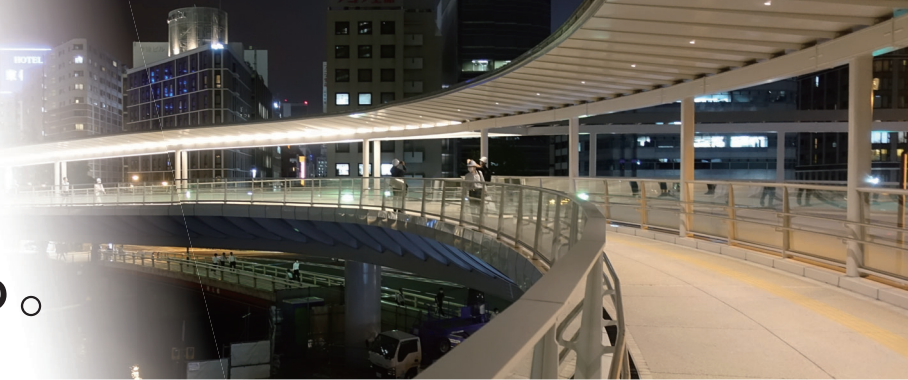
さくらみらい橋（横浜市）