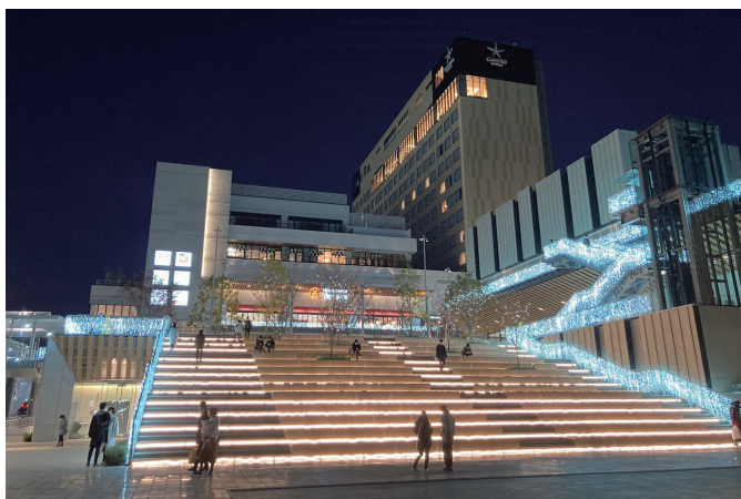
宇都宮駅東口地区整備事業（栃木県宇都宮市）

人口減少、公共施設の老朽化、厳しい財政状況などの様々な社会課題や急速な技術革新等を背景に、SDGsやSociety5.0への対応をはじめ、私たちに求められる社会的要請は複雑化・高度化しています。このような中、私たちが目指すのは「地域/事業推進の総合アドバイザー」です。まちづくりや官民連携事業等で培われたマネジメントのノウハウをいかに発揮し、各分野の専門家との協働を通じて、持続可能な社会システムの構築に貢献します。